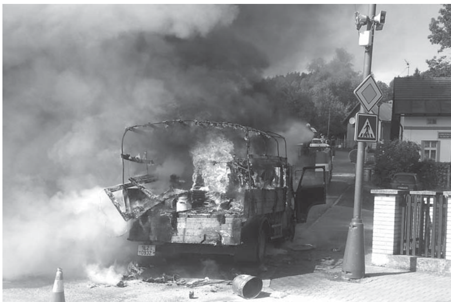
Zásah našich hasičů při požáru vozidla silničářů koncem srpna 2012