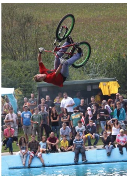
8. 09. 2012. Skoky do vody na kole Koupaliště Košťálov