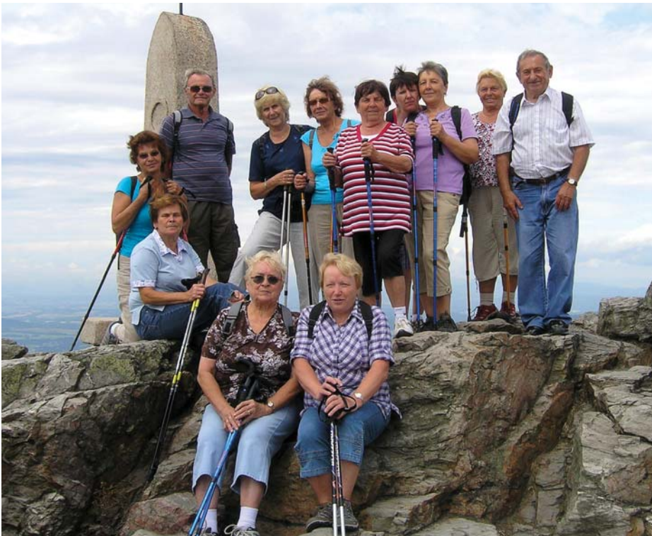
Spolek důchodců na výletě do Jeseníků