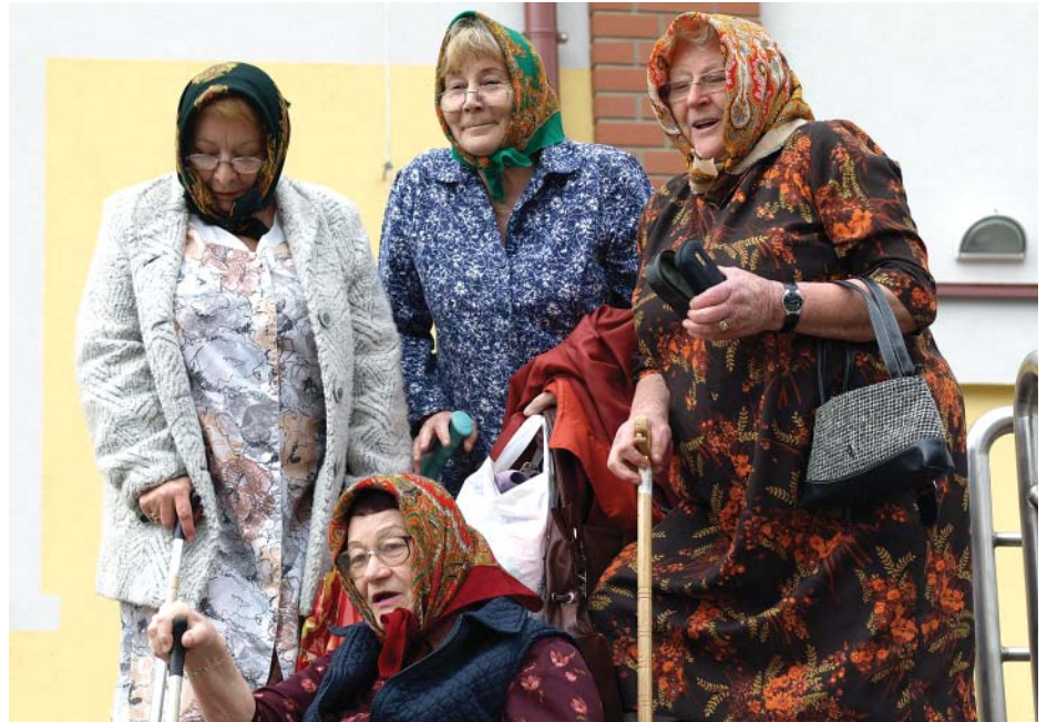
Před odjezdem na III. sousedské posezení do Kundratice

Schváleno bylo uzavření Darovací smlouvy na uložení „povodňového odpadu“ a návrh na uzavření smlouvy o bezúročném půjčce. Obě smlouvy vyplývají z usnesení č. 142/10, které zní: Jako formu pomoci obcím postiženým povodněmi z 7. srpna 2010 zastupitelstvo schvaluje slevu a půjčku na poplatek za odpad z povodni uložený na skládce Marius Pedersen umístěné v katastru obce Košťálov podle níže uvedených pravidel: Částka přijatá od provozovatele skládky zvláště evidovaná jako povodňový zpoplatněný odpad bude celá na základě žádosti původce odpadu (obce postižené povodni) vrácena po podpisu dále uvedené dohody o půjčce. Na základě tohoto rozhodnutí zastupitelstva je pro postižené obce schválena sleva ve výši 40%. Na 60% částky poplatku za uložení odpadu bude s postiženou obcí uzavřena dohoda o bezúročném půjčce. Obce Košťálov obci postižené povodni se splatností do 30. 09. 2014. Sleva ve výši 40% se týká pouze povodňového odpadu, kdy původcem odpadu jsou obce postižené povodni ze 7. 8. 2010 do výše celkově 6 000 tun odpadu uloženého na košťálovskou skládku. Zastupitelstvo Obce Košťálov po projednání schvaluje Smlouvu o poskytnutí finančního daru ve výši 427 164 Kč městu Hrádek nad Nisou. Darovaná částka bude použita na obnovu Mateřské a Základní školy Donín, které byly postiženy povodni a kde je město Hrádek nad Nisou zřizovatelem. Dále zastupitelstvo obce Košťálov schvaluje po projednání Smlouvu o půjčce mezi městem Hrádek nad Nisou (dále jen dlužník)