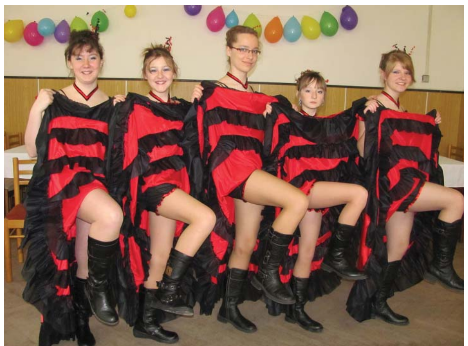
Kankán v provedení členek SDH Kundratice

26. března se konalo III. Sousedské posezení. I to se opět těšilo bohaté účasti jak místních, tak i košťálovských sousedů. O pěkný úvodní program se postarali: malí sokolíci, děvčata sokolky se sestavou aerobiku, tatáž děvčata s kankánem a samozřejmě naše „Poupata“. Ta doslova zazářila, cvičila se zlatými třásněmi a ve zlatých parukách - prostě to jsou naše „zlatý holky“! Poté se páni muzikanti postarali