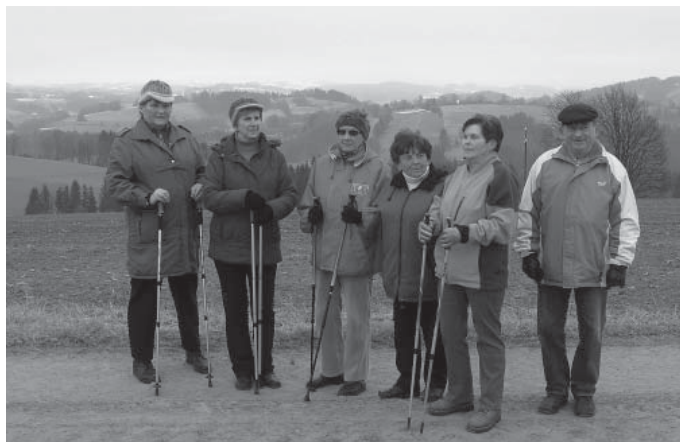
Z vycházky po okolí