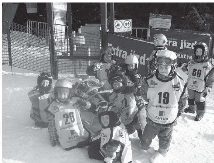
Děti z MŠ Košťálov na lyžařském výcviku v Herlíkovicích

odměněni průkazem lyžaře a 3 nejlepší medailemi z čokolády. Poděkování patří kolektivu lyžařské školy v Herlíkovicích za to, jak se starali o naše malé lyžaře, a už se těšíme za rok na shledanou.