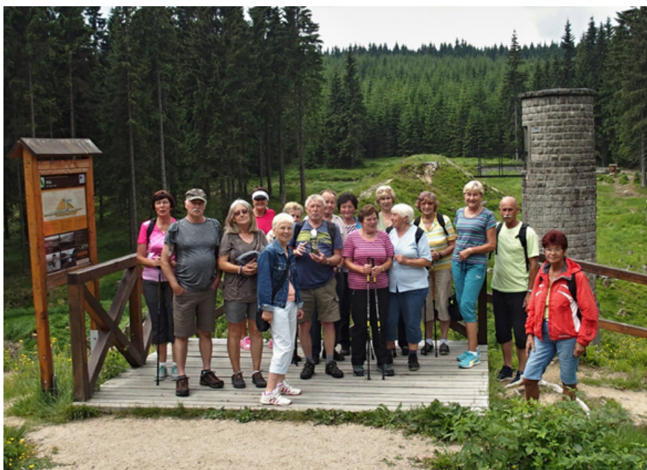
Z výletu Tourist senior clubu

Registrace: Ministerstvo kultury ČR, MK ČR E 17363.