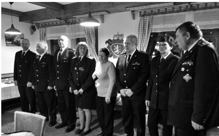
Valná hromada SDH Košťálov