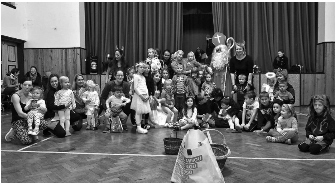
Vánoční cvičení s čerty a Mikulášem, foto Pavel Chymek

Na závěr projednávaného bodu starosta Havlík poděkoval všem zastupitelům a pravidelně navštěvujícím zástupcům veřejnosti za aktivní účast po takřka 6 měsících projednávaném bodu rekonstrukce koupaliště.