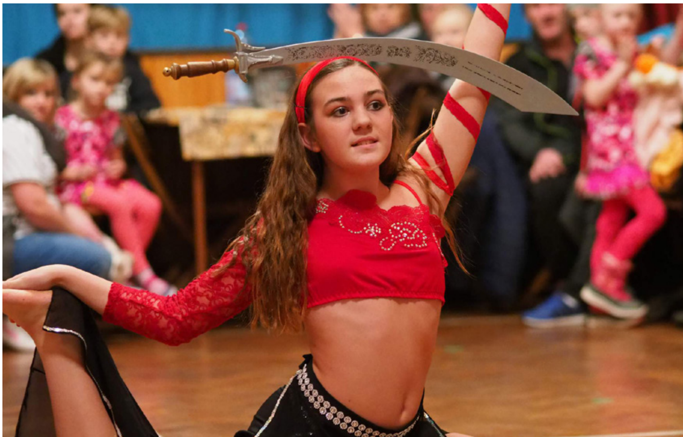
Foto z vánoční Orient párty