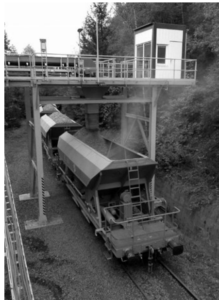
Nakládka vagonů košťálovským kamenivem už probíhá přímo v areálu lomu EUROVIA