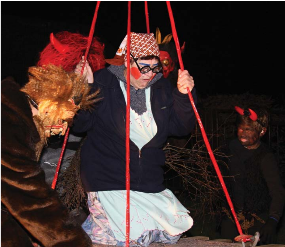
Během akce rozsvícení vánočního stromu v Košťálově došlo i k vážení hříšníků na pekelné váze.

Pravidelným bodem byla vždy kontrola hlavní stavební zakázky kanalizace a ČOV Košťálov: Tři pracovní čety pracovaly na stoce Y (od ČOV ke křižovatce u Hlubučků), jedna pracovní četa pracovala na stoce C (vpravo pod mostem na Stružinec), zde dochází současně k výstavbě nového vodovodu a jeho budoucí připojení na košťálovskou síť a zatím čtvrtá četa začala práci na stoce G (od navážky u Vávrových přes silnici nahoru Na Výsluní). Zakládací práce na objektu ČOV nabraly jisté zpoždění, především z důvodu neúspěšné aktivace podélného kotvení do svahu. Zastupitelé vyjádřili nespokojenost s postupem prací, obavy z dodržení podmínek dotace a dokončení stavby na konci roku 2015. V běžném postupu prací budou hloubeny výkopy a pokládáno potrubí hlavních stok a výkopy budou zasypávány jako provizorní pojezdné povrchy. Až následně po