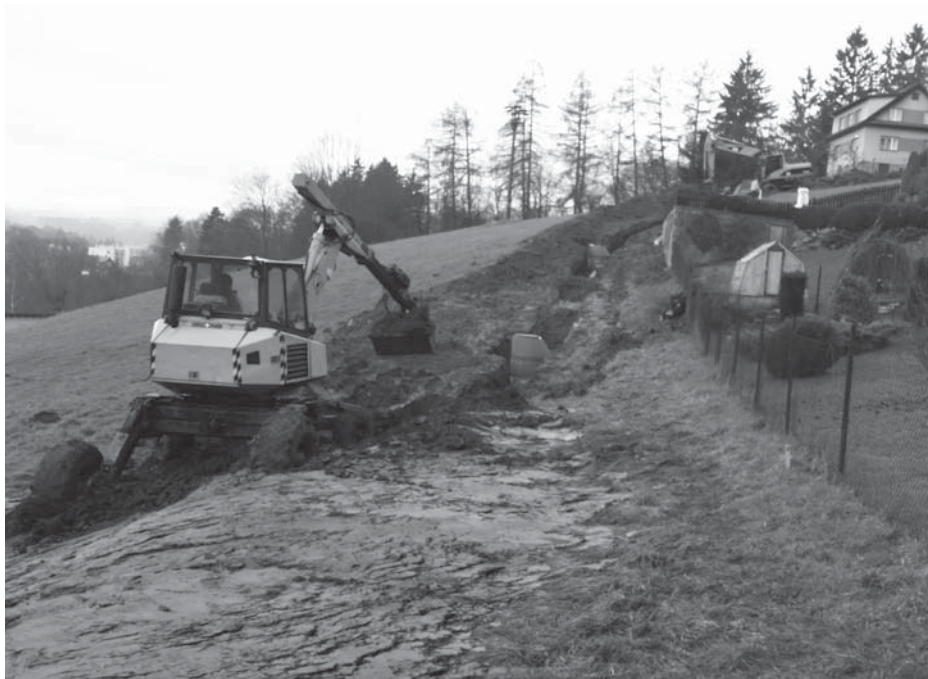
Stavba kanalizace na Letné.