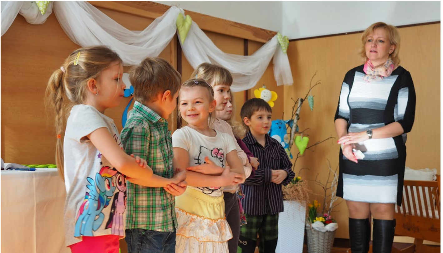
Vítání občánků 2017